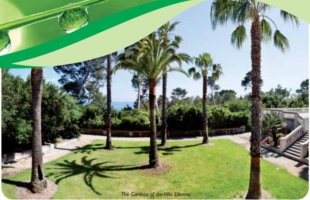
The Gardens of the Villa Eilenroc

park is perfect for discovering nature with the family on 6 km of paths. The grass land has many relaxation areas, the park has a lot of picnic tables located near the car parks.