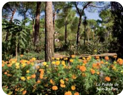
La Pinède de Juan-les-Pins

Aperto da metà giugno a metà settembre, dal martedì al sabato dalle 10 alle 18.30. Ingresso libero.