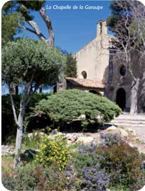
La Chapelle de la Garoupe

Grand Bacon and join the Chemin du Calvaire and the seaside. Don't miss : the Garoupe Chapel and its ex-votos collection and the marvellous viewpoint.