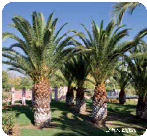
Le Parc Exflora